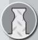
"Dog Bone" Connector

O protetor YELLOW JACKET , é o mais seguro e resistente PROTECTOR DE CABOS do mercado. Possui maior capacidade de armazenamento em seus 5 canais, garantindo a segurança de valiosos cabos elétricos e mangueiras. Com o novo conector DOG BONE, YELLOW JACKET garante maior versatilidade na interligação dos módulos, e na montagem de diferentes layouts. YELLOW JACKET suporta mais de 16 TONELADAS por eixo, o que o torna ideal para utilização industrial, comercial e pública em grandes shows e eventos.