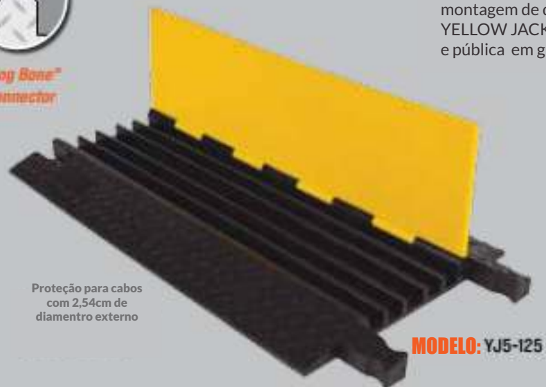
Proteção para cabos com 2,54cm de diâmetro externo